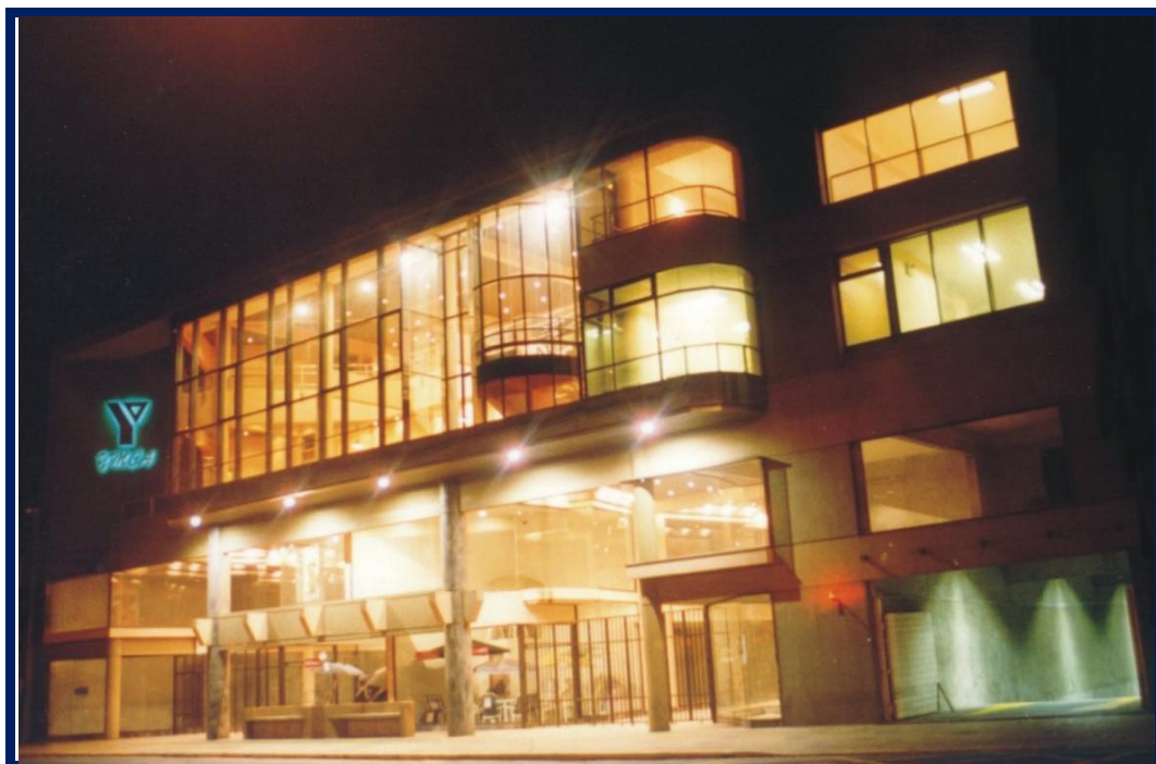
O'Higgins 825 año 1996.