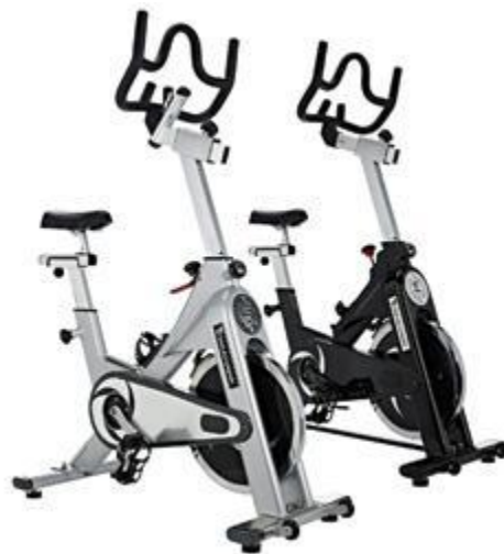
Nuevas Bicicletas para Ycycling