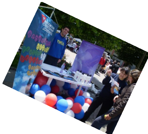
La YMCA en la Plaza de Armas