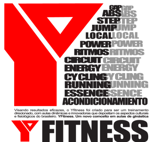
Nuevos Programas de la YMCA