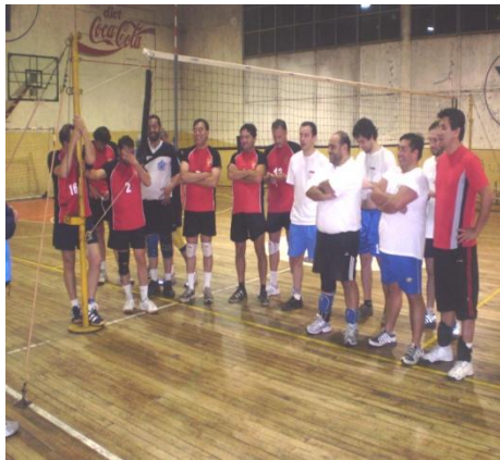
Jugadores de Vóleibol