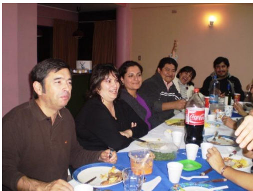
Convivencia de Socios

Los profesores del departamento físico junto a sus representantes de clase, realizaron en forma semestral, convivencias con sus respectivos grupos de clases. Realizando durante el año 2009 más de 50 convivencias de clases.