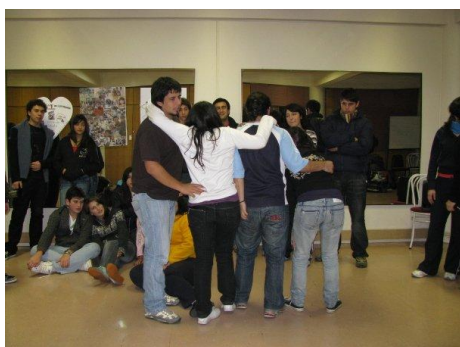
Jóvenes en taller de Líderes

Durante el mes de Julio y Diciembre, se realizó el tradicional OVERNIGHT juvenil, actividad que busca entregar una instancia y espacio de entretención y convivencia sana, en ausencia de alcohol y cigarrillos. Esta actividad está destinada a jóvenes socios de 13 a 19 años, la jornada incluye actividades recreativas y deportivas durante toda la noche, finalizando a las 07,30 horas del día siguiente.