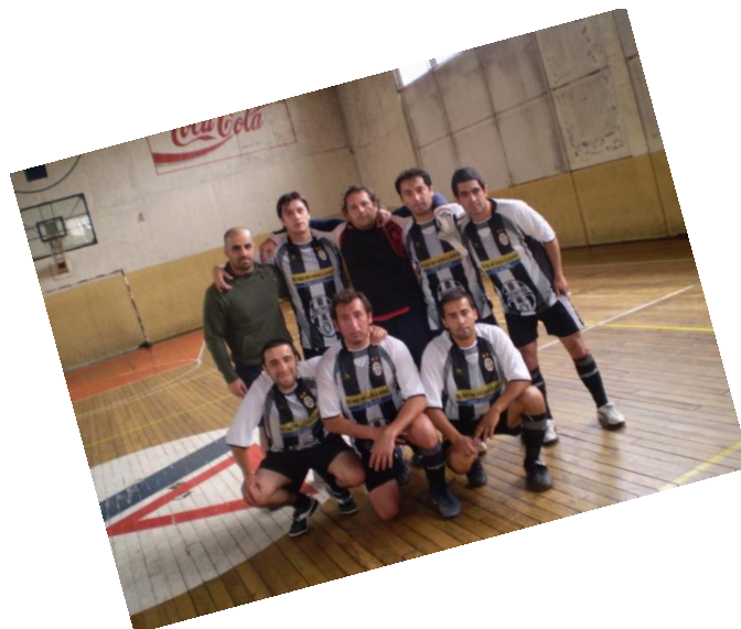
Socios Jóvenes, Campeones de Baby Fútbol

Para los fanáticos del Baby Fútbol, durante todos los domingos de noviembre, se desarrolló el Encuentro de Baby Fútbol adulto. Esta actividad cuenta con la participación de los diferentes horarios de clases de Baby futbol de nuestra Institución y reúne a más de 100 socios participantes.