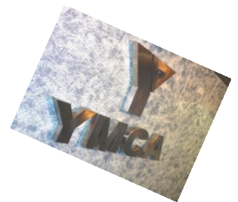
Módulos de atención de consultas e informaciones para socios nuevos.