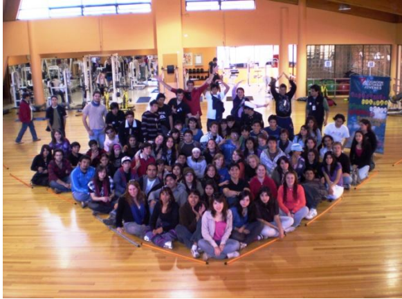
Líderes de las 6 YMCAs de Chile.

ENALI 2009, el encuentro nacional de líderes, es un Evento de carácter Nacional, bajo una temática institucional, orientada a los jóvenes de nuestra asociación. Esta actividad se desarrollo en la YMCA de Concepción, con la participación de más de 120 jóvenes de las distintas YMCAs de Chile.