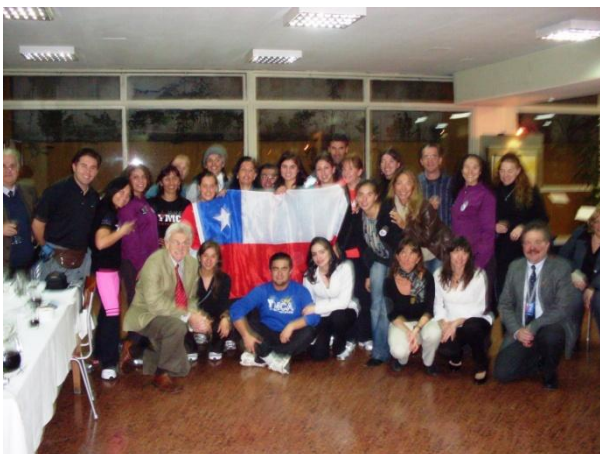
Profesores en Uruguay

Participación en la Convención Internacional de Educación Física y Salud, organizada por la YMCA de Montevideo. Esta convención fue dirigida a profesionales del área de la Educación física y la Salud, destacando la participación de las delegaciones de Argentina, Chile y Brasil, junto a la participación de 9 profesores de Concepción.