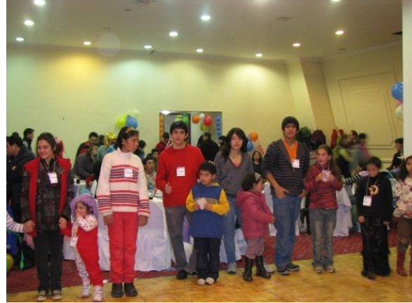
Niños en tratamiento de visita en la YMCA