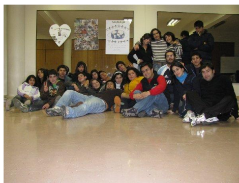
Hora de descanso

Nuestro tradicional curso de líderes, realizado entre octubre y diciembre de 2009, concentró la participación de más de 25 jóvenes entre 14 y 20 años, socios de nuestra institución. El objetivo de este curso es entregar herramientas personales a los Jóvenes, para que puedan integrarse con eficacia y formalidad, en el trabajo de promover y ejecutar actividades con sus pares, en un contexto saludable y moralmente aceptado por la filosofía de la institución, con el fin de mejorar la salud física, psicológica y espiritual de nuestros jóvenes.