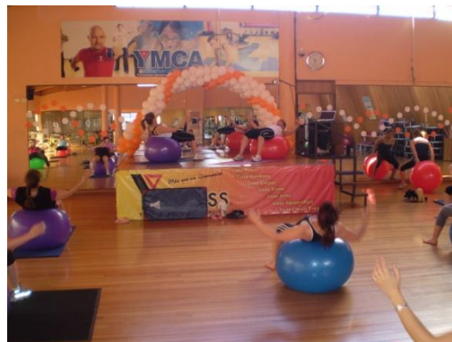
Clase de YFitball