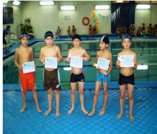
Campeones de Natación