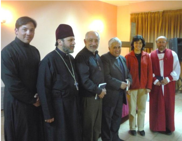
Celebración del “Día de la Biblia” con integrantes de la Fraternidad Ecuménica de Concepción

En el mes de Octubre se constituyó oficialmente, bajo los auspicios de la YMCA, la Fraternidad Ecuménica de Concepción, que funcionó quincenalmente en dependencias de la YMCA y tuvo activa participación en la celebración del “Día de la Biblia”.