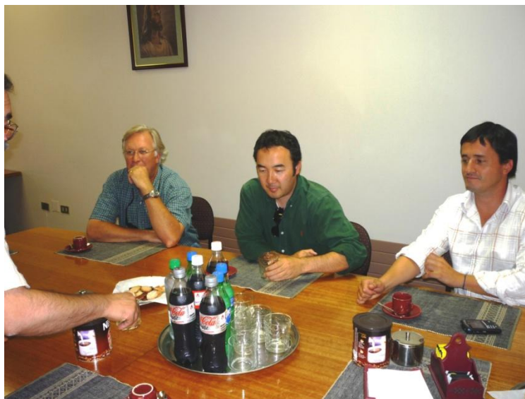
Representantes de ECOMAS en la YMCA