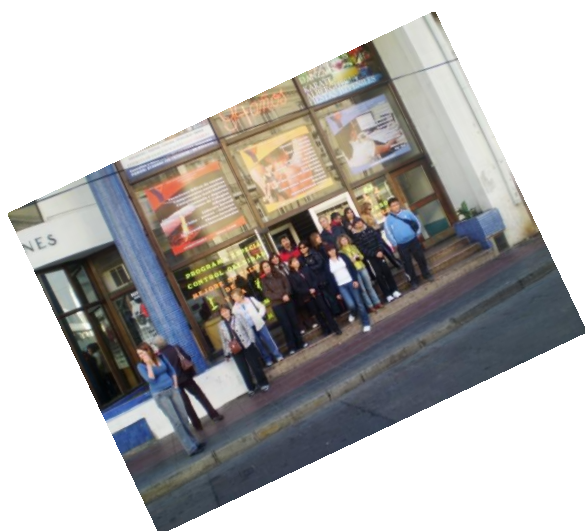
Socios en Valparaíso

En Mayo, se realizaron los tradicionales Juegos Nacionales, actividad que tiene por objetivo promover la actividad física, recreativa y social entre las YMCAs de Chile. En esta ocasión los anfitriones fueron la YMCA de Valparaíso y la actividad se desarrollo con la participación de las YMCAs de Antofagasta, Santiago, Temuco y Concepción.